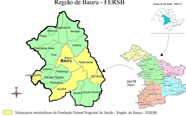
Municípios Instituidores da Fundação Estatal Regional de Saúde Região de Bauru - FERSB